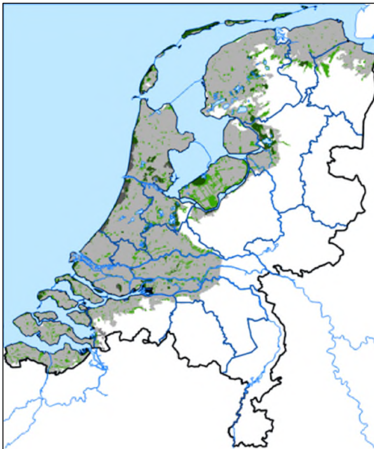
Figuur 3. Gedeelte van Nederland waar verzilting op kan treden (in grijs) en de Natura2000 habitattypen (in donkergroen) en NNN beheertypen (in lichtgroen) die effecten van verzilting kunnen ervaren.

In het afwegingskader zoet-zout dynamiek (STOWA, 2025) wordt uiteengezet welke (semi)terrestrische vegetatietypen te maken kunnen krijgen met verzilting in Laag-Nederland (Figuur 3) en welke typen gevoelig zijn voor verzilting. De meest gevoelige Natura2000 habitattypen zijn vochtige duinvalleien, vochtige heide, stroomdal- en heischrale graslanden, blauwgraslanden, trilvenen en veenmosrietland, pioniervegetaties met snavelbiezen, galigaan- en kalkmoerassen en hoogveenbossen. De meest gevoelige beheertypen binnen het Natuurnetwerk Nederland (NNN) zijn veenmosrietland en moerasheide, vochtige heide, trilveen en nat schraalland. Dit betreffen vooral soortenrijke, zoete, voedselarme tot matig voedselrijke systemen, waarvan de meeste in laagveengebieden liggen. Het is hierbij wel de vraag in welke mate ingelaten water met een hoger zoutgehalte de wortelzone van kwetsbare terrestrische ecosystemen kan bereiken.