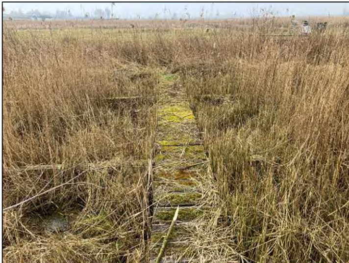
Figuur 2. Mogelijke onderzoekslocatie met mesocosms in het IJperveld (Noord-Holland).